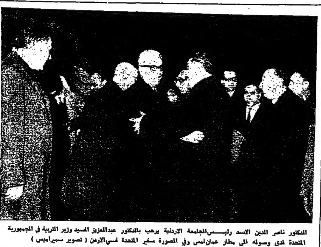
المشكور ناصر الدين الاسد رئيس الجامعة الأردنية يرحب بالمشكور عبد العزيز السيد وزير التربية في الجمهورية المتحدة لدى وصوله الى مطار عمان أمس وفي الصورة سفر المتحدة نسي الامرن